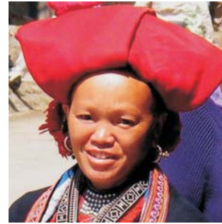
Vielvölkerstaat: Hmong (links) und Dao (rechts) im Nordwesten Vietnams