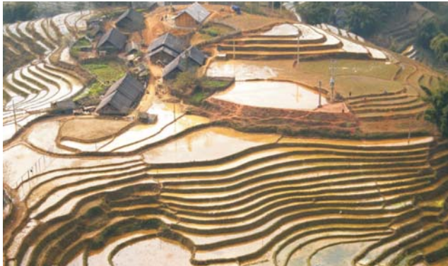
Reisterrassen im Muong Hoa-Tal

Einst durch Krieg geschunden, öffnete sich Vietnam vor Jahren dem interessierten Reisenden. Es erstaunt dabei durch ein rasantes Wirtschaftswachstum und zählt heute zu den sichersten Ländern Südostasiens. Mit über 3400 km Küste erstreckt sich Vietnam als schmaler Streifen entlang dem Südchinesischen Meer. Zwischen den Kernräumen, dem Mekong-Delta mit Saigon (Ho Chi Minh Stadt) im Süden, Annam mit Hue und Da Nang im Zentrum sowie dem Tiefland des Roten Flusses mit Hanoi im Norden, wird das Land von markanten Gebirgslandschaften geprägt. Mit phantastischer Natur und kulturell sehr unterschiedlichen Regionen, bietet Vietnam eine äußerst spannende Vielfalt. Die Exkursion umfasst deshalb, neben den genannten Zentren, der Deltalandschaft des Mekong mit seinen zahlreichen Wasserläufen sowie der Halong-Bucht mit ihren atemberaubenden Karstlandschaften im Delta des Roten Flusses, unter anderem auch kleine Dörfer im Trung Son-Gebirge (Süd- und Zentralvietnam) und im nördlichen Gebirgsland an der Grenze zu China. In diesen Rückzugsgebieten treffen wir auf zahlreiche ethnische Minderheiten, von den Mon und Khmer im Süden bis zu den Hmong, Dao und Tai-Völkern im Norden. Die Kaiserstadt Hue, Altstadt von Hoi An und die Tempelstadt My Son findet man dabei ebenso auf der UNESCO-Welterbeliste wie die Zitadelle von Hanoi und die Halong-Bucht.