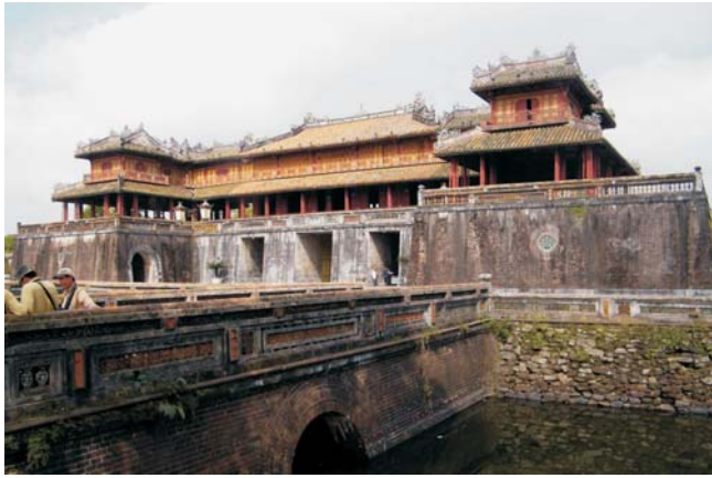
Kaiserpalast in Hue: Mittagstrog