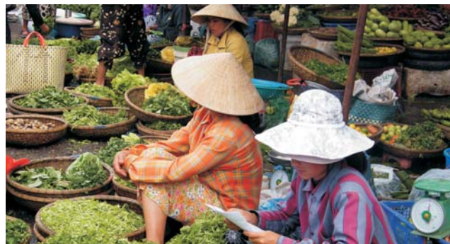
Markt in Dong Ba

GEOPULS wurde 2004 von Dozenten des Geographischen Instituts in Tübingen gegründet und arbeitet seitdem mit ausgewählten Volkshochschulen zusammen. Begeisterte Geographen, die ein Land durch Ihre Arbeit von allen Seiten kennengelernt haben, führen Sie durch Kultur und Natur des Reiseziels, wobei es, neben den touristischen Höhepunkten, immer noch etwas mehr zu sehen und zu erleben gibt. Wenig Bekanntes, tiefe Einblicke, das Erkennen von Zusammenhängen in Kultur- und Naturraum, Hintergründiges. Ausflüge in die Natur mit der einen oder anderen kleinen Wanderung gehören dazu, um auch die landschaftlichen Besonderheiten und deren Schönheit kennenzulernen und zu genießen. Die Teilnehmerzahl ist je nach Reise auf angenehme 12 bis max. 16 Personen beschränkt, was auch noch ein Reisen abseits massentouristischer Strukturen ermöglicht.