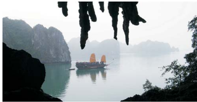
Bucht von Halong am frühen Morgen

dieser Folder wurde CO 2 -neutral hergestellt