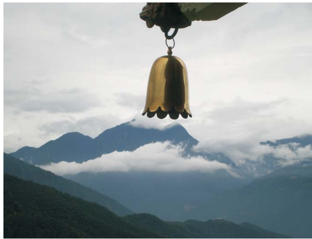
Kulisse des Zentralen Berglands am Sonne-Mond-See

dieser Folder wurde CO 2 -neutral hergestellt