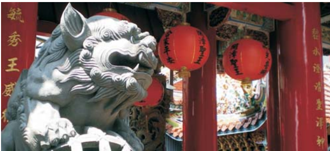
daoistischer Bishan-Tempel im Südosten von Taipei