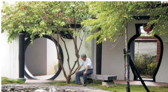
Lin An Tai: Garten-Architektur der Qing-Dynastie aus dem 18. Jh. in Taipei

Sauber wie Japan, locker wie Thailand - nach seiner enormen wirtschaftlichen Entwicklung, gehört Taiwan heute zu den Ländern mit dem höchsten Wohlstand. Der hohe Lebensstandard spiegelt sich in allen Bereichen wider: angefangen bei der hervorragenden Infrastruktur, über das Gesundheitswesen, bis hin zur vorbildlichen Bildungspolitik. Der unglaubliche Reichtum an chinesischen Kulturgütern und die teils atemberaubenden Landschaften dieser großen Insel lohnen auf jeden Fall die Anreise. Von den Portugiesen zu recht Ilha Formosa (die schöne Insel) genannt, lockt Taiwan bis heute mit einer einzigartigen subtropischen Vegetation. Der größte Teil der Insel wird durch Bergmassive mit fast 4000 m Höhe geprägt. Heiße Quellen deuten auf eine recht junge Entstehung - das Gebirge zählt zu den jüngsten weltweit. Ein