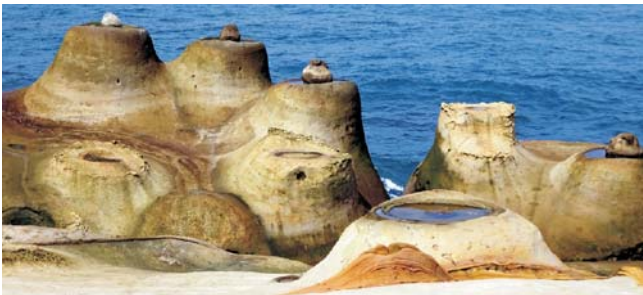
außergewöhnliche und bizarre Küstenformen im Yeliu-Geopark

Nach der Anmeldung zu dieser Exkursion wird mit der von GEOPULS zugesandten Buchungsbestätigung eine Anzahlung (15 % des Reisepreises) fällig. Die Restzahlung erfolgt zwei Wochen vor Reisebeginn. Es gelten die Geschäftsbedingungen des Veranstalters: Geopuls GbR, Neckarhalde 62, 72108 Rottenburg (Tel. 07472-9808802). Bitte beachten Sie vor Reisebuchung unsere Allgemeinen Reisebedingungen sowie das Formblatt zur Unterrichtung des Reisenden bei einer Pauschalreise nach § 651a des BGB (EU-Richtlinie 2015/2302). Beides schicken wir vor Buchung gerne zu, oder kann auf/von der Webseite www.geopuls.de eingesehen und ausgedruckt werden.