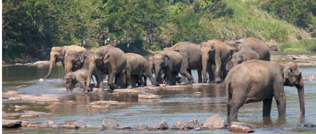
Sri Lankas Nationalparke bewahren ein tropisches Inselparadies mit einer Vielzahl an Tieren und einer außergewöhnlichen Pflanzenwelt