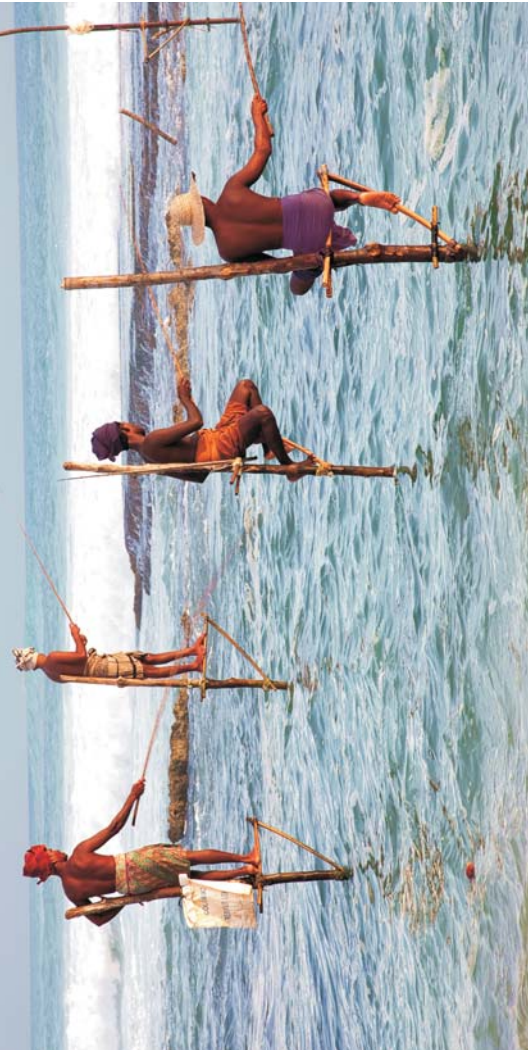
Titelbild: Stelzenfischer am indischen Ozean