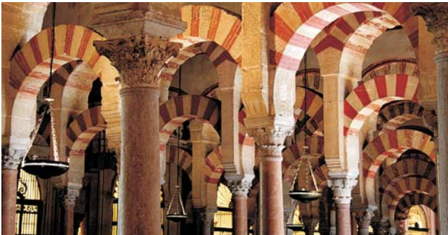
Moschee und Kathedrale zugleich - die Mezquita von Córdoba

Unsere Aufmerksamkeit gilt genauso der Vielfalt an außergewöhnlichen Naturlandschaften. Einige Ausflüge mit kleinen Wanderungen/Spaziergängen und Stopps unterwegs, führen uns immer wieder auch zu den Sehenswürdigkeiten der Natur. Die Gebirgslandschaften der Sierra Nevada und der Alpujarra Alta mit den berühmten weißen Dörfern und Relikten einstiger maurischer Besiedlung stehen ebenso auf dem Programm wie die faszinierenden tief zerschnittenen Plateaulandschaften der subbetischen Cordillere oder die bizarre Karstlandschaft im Naturreservat des El Torcal. Um das Flair der berühmten Städte Andalusiens so authentisch wie möglich einzufangen, beziehen wir stets Unterkunft inmitten der historischen Altstädte und einmal auch auf einer, heute in ein Hotel umgewandelten, ehemaligen Finca in den Bergen der Alpujarras.