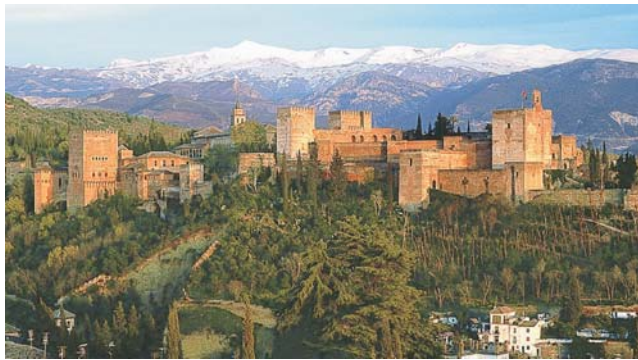
die Alhambra von Granada im Abendlicht mit den Bergen der Sierra Nevada

dieser Folder wurde CO 2 -neutral hergestellt