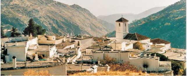
im uralten Bergdorf Capileira in den Alpujarras beziehen wir Quartier in 1435 m

Nach der Anmeldung zu dieser Exkursion wird mit der von GEOPULS zugesandten Buchungsbestätigung eine Anzahlung (15% des Reisepreises) fällig. Die Restzahlung erfolgt zwei Wochen vor Reisebeginn. Es gelten die Geschäftsbedingungen des Veranstalters: Geopuls GbR, Neckarhalde 62, 72108 Rottenburg (Tel. 07472-9808802). Bitte beachten Sie vor Reisebuchung unsere Allgemeinen Reisebedingungen sowie das Formblatt zur Unterrichtung des Reisenden bei einer Pauschalreise nach § 651a des BGB (EU-Richtlinie 2015/2302). Beides schicken wir vor Buchung gerne zu, oder kann auf/von der Webseite www.geopuls.de eingesehen und ausgedruckt werden.