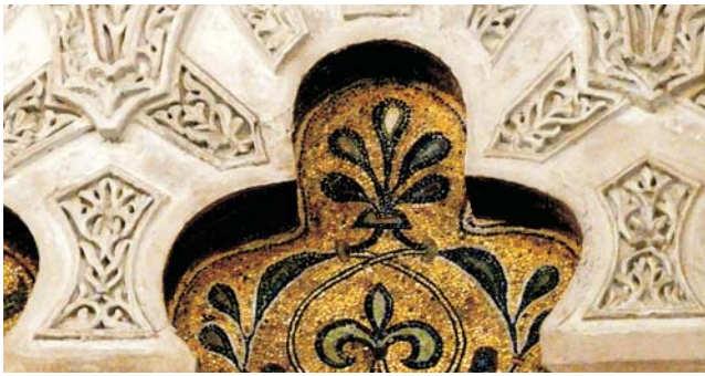
Detail Vielpassbogen im Mihrab der Mezquita, Córdoba

Nach der Anmeldung zu dieser Exkursion wird mit der von GEOPULS zugesandten Buchungsbestätigung eine Anzahlung (15% des Reisepreises) fällig. Die Restzahlung erfolgt zwei Wochen vor Reisebeginn. Es gelten die Geschäftsbedingungen des Veranstalters: Geopuls GbR, Neckarhalde 62, 72108 Rottenburg (Tel. 07472-9808802). Bitte beachten Sie vor Reisebuchung unsere Allgemeinen Reisebedingungen sowie das Formblatt zur Unterrichtung des Reisenden bei einer Pauschalreise nach § 651a des BGB (EU-Richtlinie 2015/2302). Beides schicken wir vor Buchung gerne zu, oder kann auf/von der Webseite www.geopuls.de eingesehen und ausgedruckt werden.