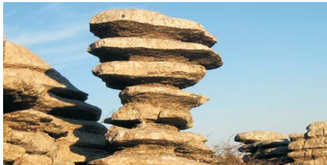
im Karstgebiet des El Torcal bei Antequera

GEOPULS als Veranstalter für alle, am wirklichen Reisen interessierten Menschen, wurde 2004 von ehemaligen Dozenten des Geographischen Instituts in Tübingen, gegründet. Geopuls arbeitet seitdem ausschließlich mit der vhs zusammen. Begeisterte Geographen und Landeskundler, die Natur, Kultur und Hintergründe eines Ziellandes bestens vermitteln können, führen Sie bei diesen Exkursionen. Wir versuchen dabei, ein Land möglichst umfassend zu bereisen, was bedeutet, dass neben den berühmten Sehenswürdigkeiten auch die Landesnatur Beachtung und Erklärung findet. Kleine Wanderungen und Spaziergänge in die Natur bieten deshalb immer wieder eine schöne und interessante Abwechslung zum Kulturprogramm. Nicht zuletzt gilt es, ein Land so authentisch wie möglich zu erfahren und dabei auch die oft übersehenen kleinen Dinge zu entdecken. Dies geht am besten in einer kleineren Gruppe, weshalb die Teilnehmerzahl begrenzt ist.