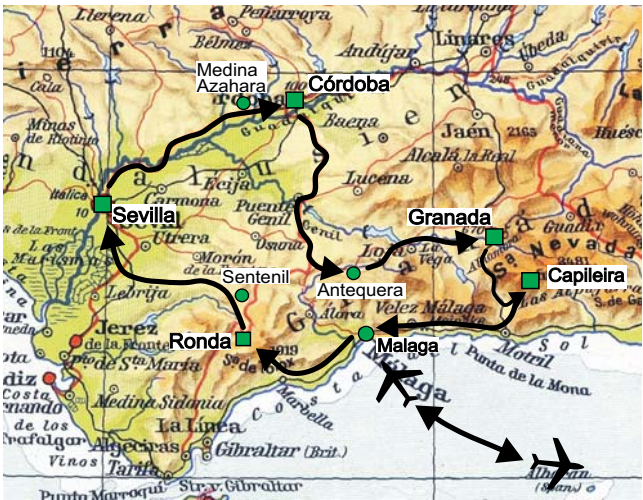
Geopuls-Exkursionsroute Andalusien ■ Übernachtungsorte ● sonstige wichtige Station