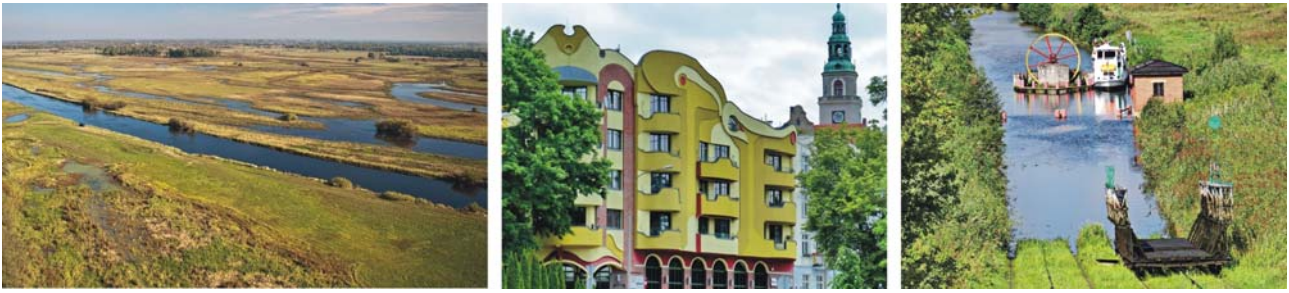
Flussmarsch der Biebrza (links), Jugendstil in Olsztyn (Mitte) und Oberländischer Kanal (rechts)

Oberländischer Kanal: Die fünf Rollberge, auf denen die Schiffe zur Bewältigung des Höhenunterschieds von 99 m auf Schienenwagen über Land transportiert werden, gelten heute als touristische Attraktion. Sie sind als Standseilbahnen ausgelegt, die von Wasserrädern angetrieben werden. Das Kanalsystem steht als technisches Bauwerk unter Denkmalschutz.