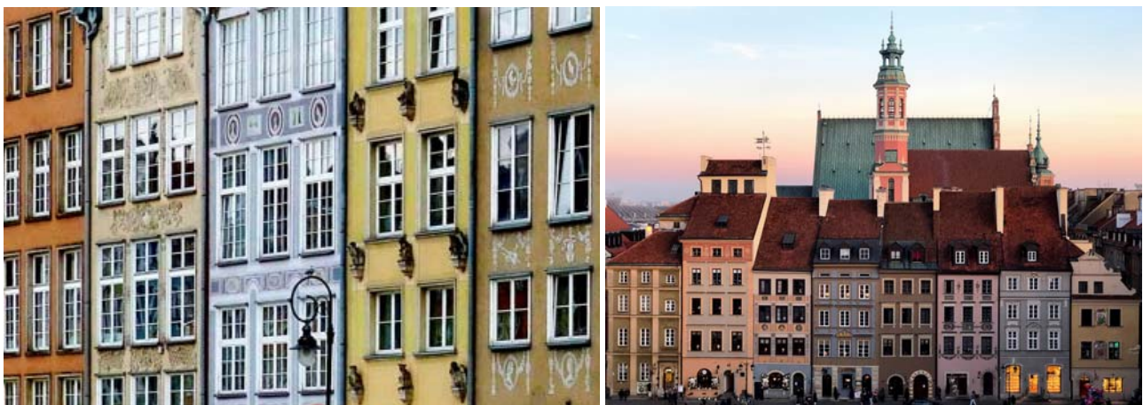
Häuserfassaden in der Altstadt von Danzig (links) und Abendstimmung in der wieder aufgebauten Altstadt von Warschau (rechts)