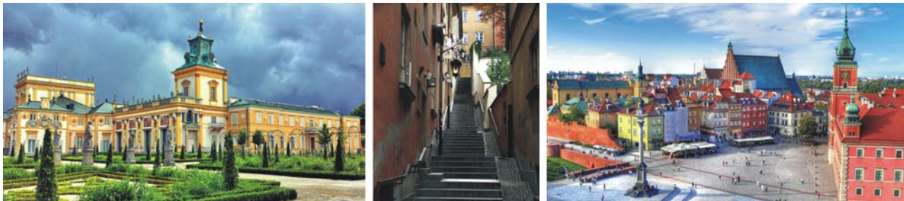
Warschau: Wilanów-Palast (1677-1679) am Königsweg, steile Treppengasse zur Weichsel, Schlossplatz mit Johanneskathedrale (1313-1321/ 1948-1956)

Unterkunft: Hotel Mercure Grand**** (2 Ü in Warszawa / Danzig)