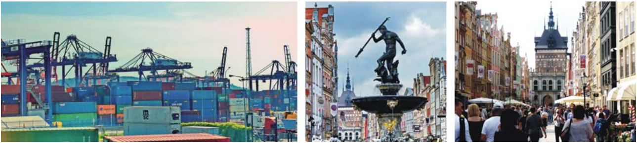
Containerhafen in Gdynia (links), Neptunbrunnen (Mitte) und Goldenes Tor (rechts) in der Innenstadt von Danzig