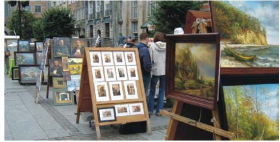
Altstadt von Danzig an der Motława mit dem Krantor (links) und Kunstmarkt in der Marienstraße