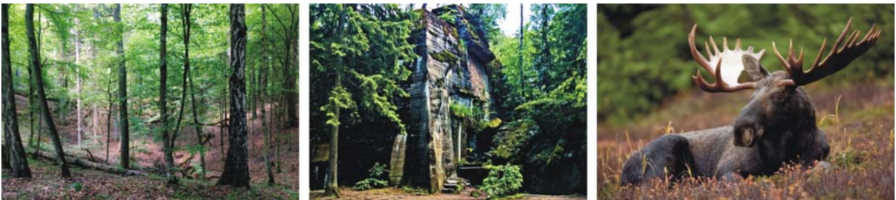
Mischwald auf einer Endmoräne (links) Bunker der Wolfsschanze (Mitte) und Elch im Biebrza-Nationalpark

Unterkunft: Hotel Huszcza*** (2 Ü in Mrągowo / Sensburg) Bartłowizna (1 Ü in Goniądz / Goniönds)