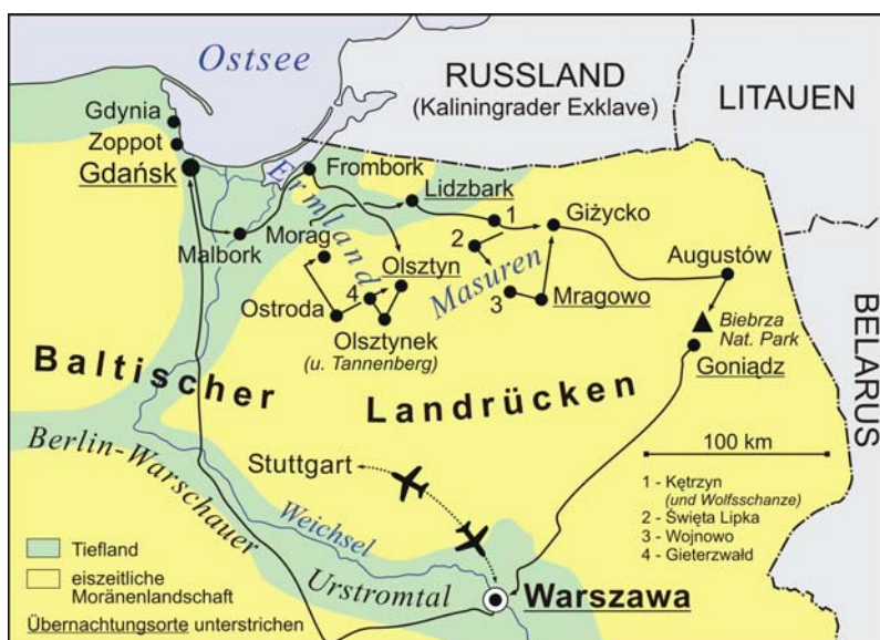
Reiseziele und -route im Überblick