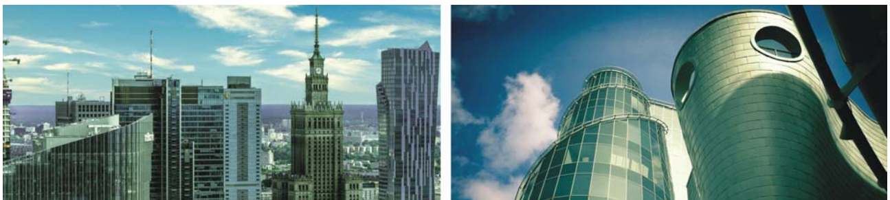
Skyline des modernen Warschau, in der der stalinistische Kulturpalast (Mitte rechts) optisch fast verschwindet, Bauten aus Glas und Aluminium (21. Jh.)

Bis zum Flughafentransfer am Nachmittag verbleibt noch genügend Zeit für ein gemütliches und ausgedehntes Frühstück als auch für eigene Erkundungen in Warschau. Der Direktflug mit LOT nach Stuttgart findet voraussichtlich erst 17:10-19:05 Uhr statt.