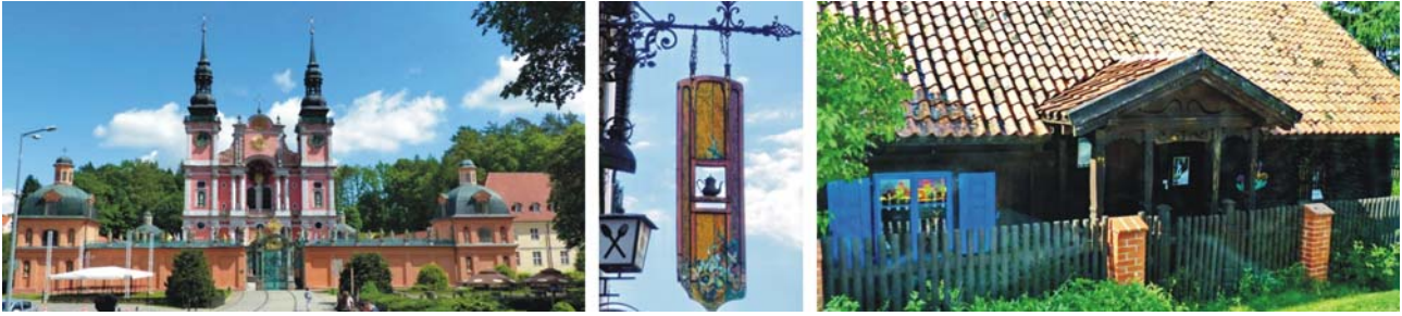
Barocke Basilika in Świąta Lipka (links), Wirtshausschild (Mitte) und traditionelles, ländliches Wohnhaus in Wojnowo (rechts)

Weichsel-Delta aus. Neben den genannten Großformen bereichern zahlreiche kleinere Formen der glazialen Serie, als Hinterlassenschaften der Eiszeit, das abwechslungsreiche Landschaftsbild.