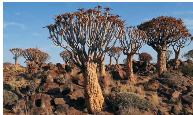
Köcherbäume ( Aloe dichotoma )

GEOPULS als Reiseveranstalter wurde 2004 von Dozenten des Geographischen Instituts in Tübingen gegründet und arbeitet seitdem mit ausgewählten Volkshochschulen zusammen. Begeisterte Geographen, die ein Land durch Ihre Arbeit während vieler Aufenthalte von allen Seiten kennen gelernt haben, führen Sie durch Kultur und Natur des jeweiligen Reisezieles. Bei einer Reise mit Geographen gibt es, neben den touristischen Höhepunkten, immer noch etwas mehr zu sehen und zu erleben. Wenig Bekanntes, tiefe Einblicke, das Erkennen von Zusammenhängen in Kultur- und Naturraum, Hintergründiges. Ausflüge in die Natur mit der einen oder anderen kleinen Wanderung gehören dazu, um auch die landschaftlichen Besonderheiten und deren Schönheit kennenzulernen und zu genießen. Die Teilnehmerzahl ist je nach Reise auf angenehme 12 bis max. 16 Personen beschränkt, was auch noch ein Reisen abseits massentouristischer Strukturen ermöglicht.