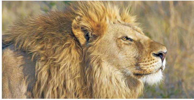
Löwe ( Panthera leo ) im Etosha-Park

Nach der Anmeldung zu dieser Exkursion wird mit der von GEOPULS zugesandten Buchungsbestätigung eine Anzahlung (15 % des Reisepreises) fällig. Die Restzahlung erfolgt zwei Wochen vor Reisebeginn. Es gelten die Geschäftsbedingungen des Veranstalters: Geopuls GbR, Neckarhalde 62, 72108 Rottenburg (Tel. 07472-9808802). Bitte beachten Sie vor Reisebuchung unsere Allgemeinen Reisebedingungen sowie das Formblatt zur Unterrichtung des Reisenden bei einer Pauschalreise nach § 651a des BGB (EU-Richtlinie 2015/2302). Beides schicken wir vor Buchung gerne zu, oder kann auf/von der Webseite www.geopuls.de eingesehen und ausgedruckt werden.