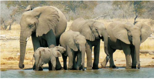
In der winterlichen Trockenzeit (Juli/August) treffen wir nicht nur die großen Zebra-, Antilopen- und Gnu-Herden an den verbliebenen Wasserlöchern - hinzu gesellen sich alle Großtierarten, vom Elefanten bis zum Löwen