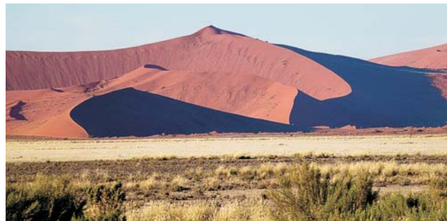
die Dünen im Sossusvlei zählen mit zu den höchsten der Welt

dieser Folder wurde CO 2 -neutral hergestellt