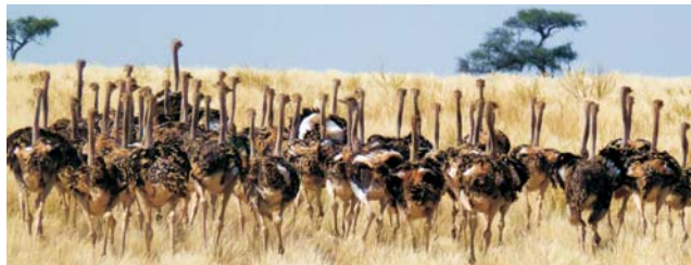
Afrikanische Strauße ( Struthio camelus )