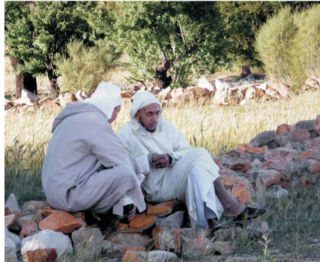
Schwätzchen in einem Mandelhain bei Tafraout im Antiatlas

Marokko ist eines der wenigen islamisch-orientalischen Länder, die immer schon problemlos bereist werden konnten. Zum Glück, denn gerade hier ist das besondere Flair dieser Kultur noch sehr lebendig: in Architektur, Kleidung, Lebens- und Wirtschaftsformen. Allein schon deswegen ist das Land eine mehr als eindrucksvolle Reiseregion. Das Schöne dabei ist, dass Massentourismus nur an ganz wenigen Plätzen eine Rolle spielt. Marokko verführt mit seinen traditionsreichen, lebhaften und faszinierenden Städten, seinen vielfältigen, oft atemberaubenden Landschaften und mit seinen ethnisch vielfältigen Kolorierungen. Auf dem Hintergrund einer Szenerie aus Tausend und einer Nacht pulsiert das tägliche Leben mit seinen bisweilen krassen Gegensätzen zwischen Nord und Süd, zwischen Stadt und Land, zwischen Tradition und Moderne. Intensiv - und nicht selten hautnah - lässt sich so etwas nur auf einer Reise durchs Land erfahren. Auf einer eindrucksvollen und wunderschönen Route bekommen Sie