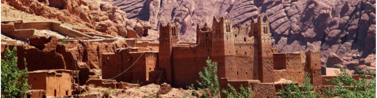
Tighremt im Dades-Tal