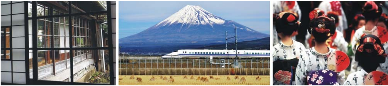
traditioneller Hausbau auf der Halbinsel Izu, Fuji San mit Hochgeschwindigkeitszug, Frauen im Yukata, dem Sommer-Kimono