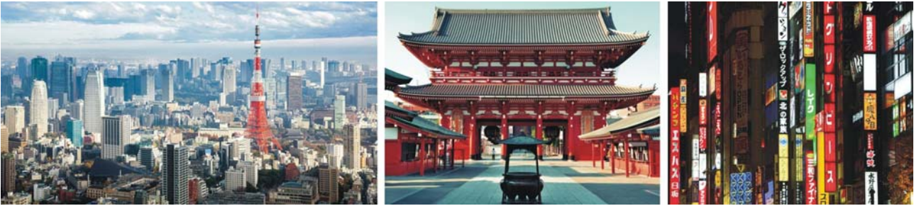
Tokyo mit Tokyo-Tower, Asakusa, Leuchtreklame in Shinjuku