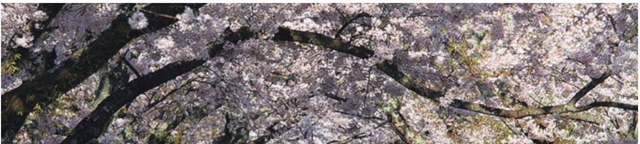
Kirschbaumalle auf der Halbinsel Izu