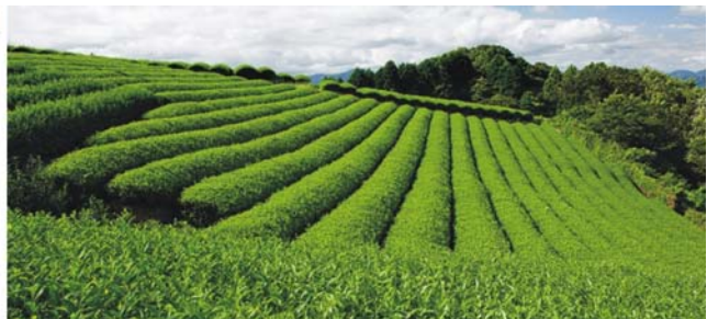
aktiver Vulkan der Aso-Caldera auf der Insel Kyūshū, Teeplantagen im Süden Japans