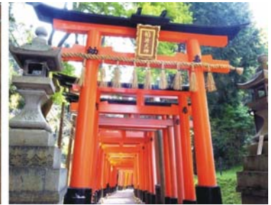
Burg von Osaka in der heutigen Innenstadt, Bronzelaternen in Nara, Torii - Torbögen in Kyoto