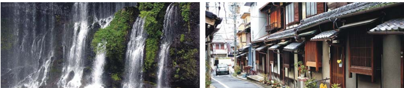
Shiraito-Wasserfall im Südwesten des Fuji-San, Wohnstraße mit älterer Bausubstanz in Kyōto

Der heutige Tag ist vollständig dem Fuji-San und seinem Umland gewidmet. Vom Fujisan Hongu Sengen Taisha, dem Hauptschrein der insgesamt rund 1.300 Sengen-Schreine, vom nahe beim Schrein gelegenen kleinen Wakutama-See (im nördlichen Teil der Stadt Fuji) und vom Shiraito-Wasserfall, von dem aus wir einen kleinen Spaziergang zum Otodome-Wasserfall unternehmen, sowie von einem der fünf Seen im Norden des majestätischen Vulkankegels, werden wir immer wieder herrliche Ausblicke auf den mächtigen Fuji-San genießen.