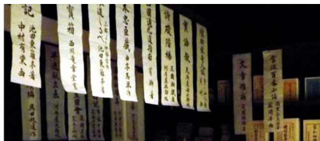
romantische Takachiho-Schlucht mit Basaltsäulen und Wasserfall, traditionelle japanische Schriftrollen