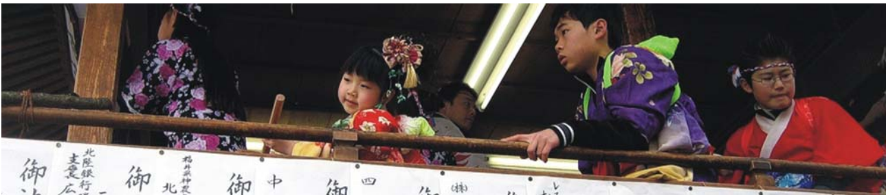
Kinder in traditioneller Kleidung

Minamata: die Kleinstadt mit knapp 25.000 Einw. im Süden von Kumamoto wurde zum Inbegriff für Umweltschäden durch unkontrollierte Verklappung von Abfällen in der Yatsushiro-See. In den 1950er Jahren litten rund 10.000 Menschen an massiven Schäden des zentralen Nervensystems, ca. 3.000 mit Todesfolge, die auf Quecksilbervergiftung durch die Abwässer eines Chemiewerks der Firma Chisso zurückgeführt werden konnten (Minamata-Krankheit).