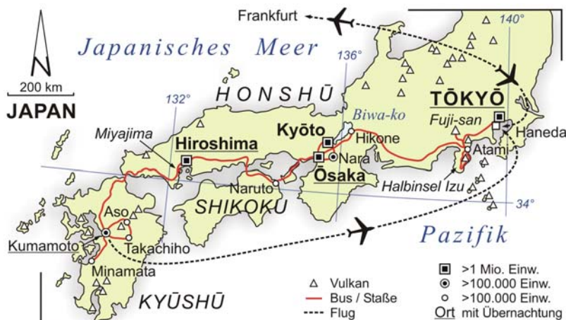
Reiseroute durch den Süden von Japan