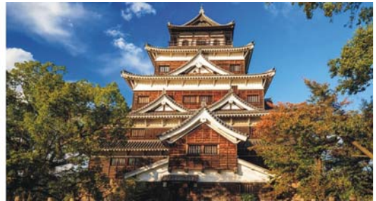
Atombombendom in Hiroshima, Torii vor dem Itsukushima-Schrein auf der kleinen Insel Miyajima, Burg aus dem 16. Jh. in Hiroshima