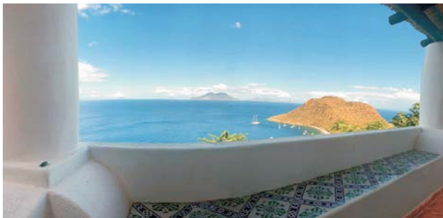
Ausblick von unserer schönen Unterkunft auf Filicudi zu den Inseln Stromboli, Panarea, Salina, Lipari und einen Teil von Vulcano (von links)

Nach der Anmeldung zu dieser Exkursion wird mit der von GEOPULS zugesandten Buchungsbestätigung eine Anzahlung (15 % des Reisepreises) fällig. Die Restzahlung erfolgt zwei Wochen vor Reisebeginn. Es gelten die Geschäftsbedingungen des Veranstalters: Geopuls GbR, Neckarhalde 62, 72108 Rottenburg (Tel. 07472-9808802). Bitte beachten Sie vor Reisebuchung unsere Allgemeinen Reisebedingungen sowie das Formblatt zur Unterrichtung des Reisenden bei einer Pauschalreise nach § 651a des BGB (EU-Richtlinie 2015/2302). Beides schicken wir vor Buchung gerne zu, oder kann auf/von der Webseite www.geopuls.de eingesehen und ausgedruckt werden.