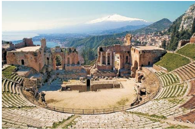
Blick vom Teatro Greco in Taormina zum schneebedeckten Ätna-Gipfel

dieser Folder wurde CO 2 -neutral hergestellt