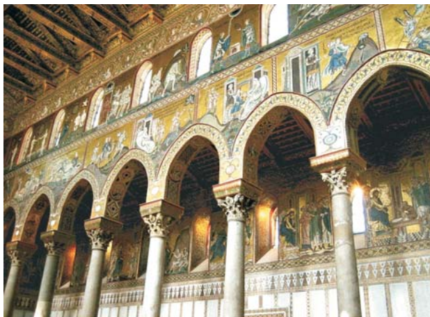
nördliches Seitenschiff im Goldenen Dom von Monreale