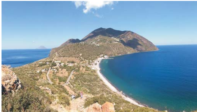
Insel Filicudi (UNESCO Weltnaturerbe) gesehen vom Capo Graziano

GEOPULS als Veranstalter für alle reisefreudigen Menschen wurde 2004 von ehemaligen Dozenten des Geographischen Instituts in Tübingen gegründet und arbeitet seitdem mit der vhs zusammen. Begeisterte Geographen und Landeskenner, die Natur, Kultur und Hintergründe eines Ziellandes bestens vermitteln können, führen Sie bei diesen Reisen. Unser Ziel ist es, ein Land in all seinen Facetten kennen zu lernen, was bedeutet, dass neben den berühmten Sehenswürdigkeiten auch die Landesnatur nicht zu kurz kommt. Kleine Wanderungen und Spaziergänge in die Natur bieten deshalb immer wieder eine schöne und interessante Abwechslung zum Kulturprogramm. Nicht zuletzt gilt es, ein Land so authentisch wie möglich zu erfahren und dabei auch die oft übersehenen kleinen Dinge zu entdecken. Dies funktioniert am besten in einer kleineren Gruppe, weshalb die Teilnehmerzahl auf 16 Personen begrenzt ist.