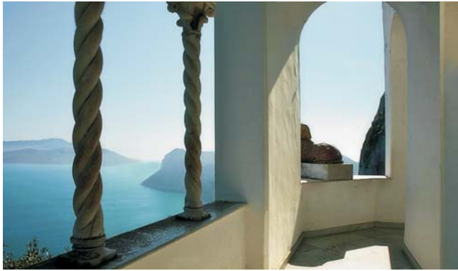
Blick von Axel Munthes Villa S. Michele bei Anacapri zur Halbinsel von Sorrent