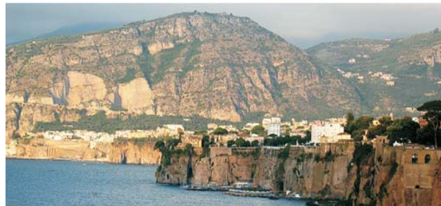
Blick auf die Tuffterrasse von Sorrent bei der Überfahrt von Capri aus.

GEOPULS als Veranstalter für alle am Reisen interessierten Menschen wurde 2004 von Dozenten des Geographischen Instituts in Tübingen gegründet. Begeisterte Geographen und Landeskundler, die Natur, Kultur und Hintergründe eines Ziellandes bestens vermitteln können, führen Sie bei diesen Exkursionen. Wir versuchen dabei, ein Land möglichst umfassend zu bereisen, was bedeutet, dass neben den berühmten Sehenswürdigkeiten auch die Landesnatur Beachtung und Erklärung findet. Kleine Wanderungen und Spaziergänge in die Natur bieten deshalb immer wieder eine schöne und interessante Abwechslung zum Kulturprogramm. Nicht zuletzt gilt es, ein Land so authentisch wie möglich zu erfahren und dabei auch die oft übersehenen kleinen Dinge zu entdecken. Dies funktioniert am besten in einer überschaubaren Gruppe, weshalb die Teilnehmerzahl bei dieser Reise auf 15 Personen begrenzt ist.