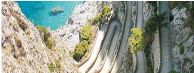
Die Via Krupp, erbaut von Stahlbaron F. A. Krupp im Jahr 1902 windet sich in einmaliger Weise von Capri-Ort hinunter zur Marina Piccola

Nach der Anmeldung zu dieser Exkursion wird mit der von GEOPULS zugesandten Buchungsbestätigung eine Anzahlung (15 % des Reisepreises) fällig. Die Restzahlung erfolgt zwei Wochen vor Reisebeginn. Es gelten die Geschäftsbedingungen des Veranstalters: Geopuls GbR, Neckarhalde 62, 72108 Rottenburg (Tel. 07472-9808802). Bitte beachten Sie vor Reisebuchung unsere Allgemeinen Reisebedingungen sowie das Formblatt zur Unterrichtung des Reisenden bei einer Pauschalreise nach § 651a des BGB (EU-Richtlinie 2015/2302). Beides schicken wir vor Buchung gerne zu, oder kann auf/von der Webseite www.geopuls.de eingesehen und ausgedruckt werden.