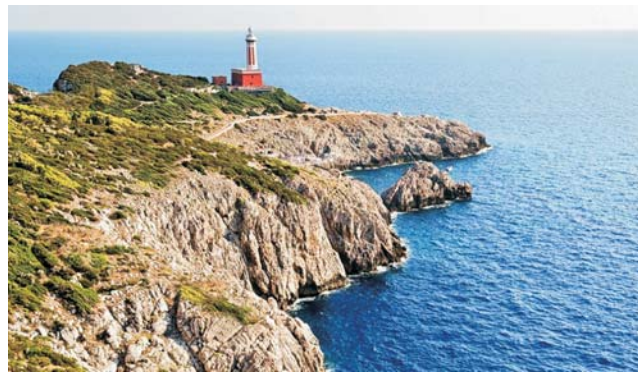
Leuchtturm von Punta Carena an Capris wilder Westküste.

dieser Folder wurde CO 2 -neutral hergestellt