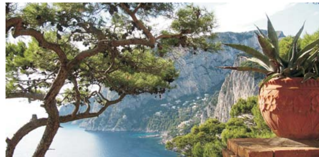
Blick von Tragara entlang der Südküste Capris

Hinweis zu den Wanderungen: normale körperliche Fitness ist vollkommen ausreichend, Sie sollten keine Schwierigkeiten beim Gehen oder bei einigen unvermeidbaren Steigungen haben.