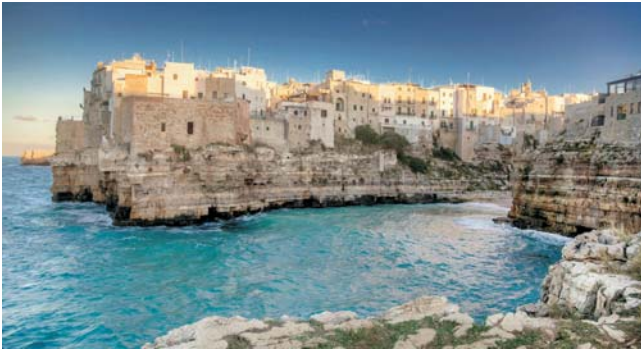
Polignano a Mare

Nach der Anmeldung zu dieser Exkursion wird mit der von GEOPULS zugesandten Buchungsbestätigung eine Anzahlung (15% des Reisepreises) fällig. Die Restzahlung erfolgt zwei Wochen vor Reisebeginn. Es gelten die Geschäftsbedingungen des Veranstalters: Geopuls GbR, Neckarhalde 62, 72108 Rottenburg (Tel. 07472-9808802). Bitte beachten Sie vor Reisebuchung unsere Allgemeinen Reisebedingungen sowie das Formblatt zur Unterrichtung des Reisenden bei einer Pauschalreise nach § 651a des BGB (EU-Richtlinie 2015/2302). Beides schicken wir vor Buchung gerne zu, oder kann auf/von der Webseite www.geopuls.de eingesehen und ausgedruckt werden.