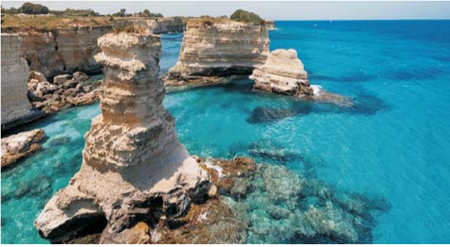
Erosions-Kliff-Küste bei Torre Sant' Andrea im Salento