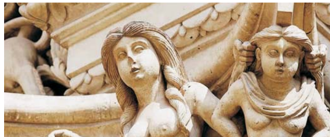
Fassadendetail in der Barockstadt Lecce

GEOPULS als Veranstalter für alle, am wirklichen Reisen interessierten Menschen, wurde 2004 von ehemaligen Dozenten des Geographischen Instituts in Tübingen, gegründet. Geopuls arbeitet seitdem ausschließlich mit der vhs zusammen. Begeisterte Geographen und Landeskundler, die Natur, Kultur und Hintergründe eines Ziellandes bestens vermitteln können, führen Sie bei diesen Exkursionen. Wir versuchen dabei, ein Land möglichst umfassend zu bereisen, was bedeutet, dass neben den berühmten Sehenswürdigkeiten auch die Landesnatur Beachtung und Erklärung findet. Kleine Wanderungen und Spaziergänge in die Natur bieten deshalb immer wieder eine schöne und interessante Abwechslung zum Kulturprogramm. Nicht zuletzt gilt es, ein Land so authentisch wie möglich zu erfahren und dabei auch die oft übersehenen kleinen Dinge zu entdecken. Dies geht am besten in einer kleineren Gruppe, weshalb die Teilnehmerzahl begrenzt ist.