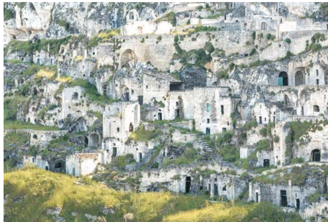
Sassi werden die Höhlenwohnungen genannt, die einen Teil der Altstadt von Matera am Steilhang der Schlucht des Flusses Gravina einnehmen. Das Welterbe Matera war 2019 außerdem Europäische Kulturhauptstadt.

dieser Folder wurde CO 2 -neutral hergestellt