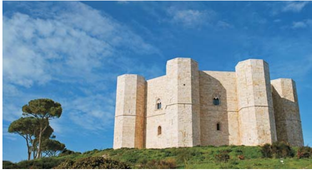
Wahrzeichen Apuliens: Castel del Monte Kaiser Friedrich II von Hohenstaufen