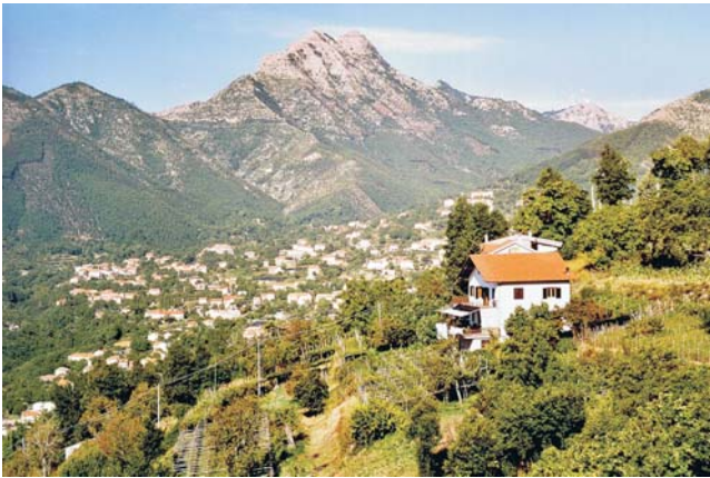
Unsere Unterkunft im Hinterland von Amalfi: ein von Reben und Edelkastanien umgebener Agriturismo mit herrlicher Aussicht auf Berge und Meer