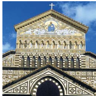
Amalfi, Detail Domfassade

dieser Folder wurde CO 2 -neutral hergestellt