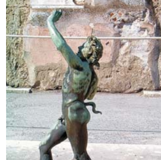
Pompeji, Tanzender Faun

GEOPULS , als Veranstalter für alle am wirklichen Reisen interessierten Menschen, wurde 2004 von ehemaligen Dozenten des Geographischen Instituts in Tübingen, gegründet. Geopuls arbeitet seitdem mit der Volkshochschule zusammen. Begeisterte Geographen und Landeskundler, die Natur, Kultur und Hintergründe eines Ziellandes bestens vermitteln können, führen Sie bei diesen Exkursionen. Wir versuchen dabei, ein Land möglichst umfassend zu bereisen, was bedeutet, dass neben den berühmten Sehenswürdigkeiten auch die Landesnatur Beachtung und Erklärung findet. Wanderungen und Spaziergänge in die Natur bieten deshalb immer wieder eine schöne und interessante Abwechslung zum Kulturprogramm. Nicht zuletzt gilt es, ein Land so authentisch wie möglich zu erfahren und dabei auch die oft übersehenen kleinen Dinge zu entdecken. Dies funktioniert am besten in einer überschaubaren Gruppe, weshalb die Teilnehmerzahl bei dieser Reise auf 14 Personen begrenzt ist.