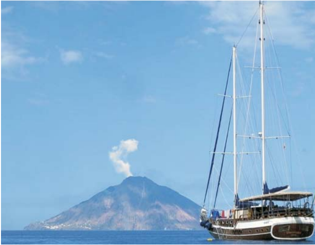
unsere Motorsegelyacht vor Stromboli. Mehr Bilder zur Yacht auf: www.geopuls.de/studienreisen/italien-8/aeolische-inseln/allgemeines