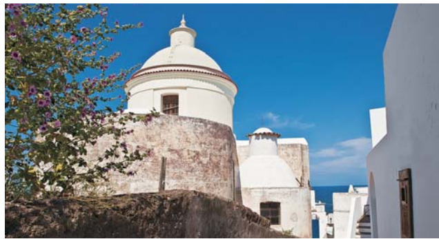
Stromboli: San Vincenzo (oben) und Filicudi (unten)

dieser Folder wurde CO 2 - neutral hergestellt