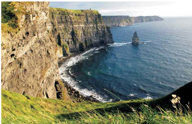
unvermittelt fallen die Cliffs of Moher 200 m steil zum Atlantik ab