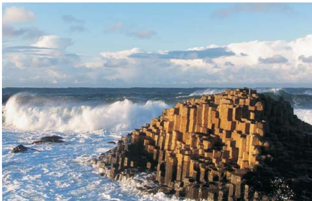
Giant's Causeway - einmalige Basaltlandschaft an der Nordküste Irlands

Wer Irland auf einer der schönsten Route über Land und entlang großartiger Küsten intensiv kennen lernen möchte, ist herzlich eingeladen, sich dieser Studienreise unter Leitung einer Tübinger Geographin anzuschließen. Sie hat, Ihrer Meinung nach, die vielfältigste 9-Tages-Tour durch Irland für Sie zusammengestellt, oft übersehene Perlen am Rande des Weges inklusive. Die Route beginnt in der impulsiven Hauptstadt Dublin, quert das Land von Ost nach West und führt entlang der grandiosen Westküste, bis in das zu Großbritannien gehörende Nord-Irland. Von Dublin bis Derry stößt man dabei auf einmalige Zeugnisse irischer Kultur und Naturlandschaften, wie z.B. die steinzeitlichen Kultstätten im Boyne-Tal. Von den urigen Pubs in Dublin, über alte keltische Kloster-siedlungen, die spektakulären Cliffs of Moher, die Fjordküste bei Clifden und Kylemore Abbey, bis hin zu den 37.000 Basalt-säulen des Giant's Causeway bietet Irland stets Besonderes!