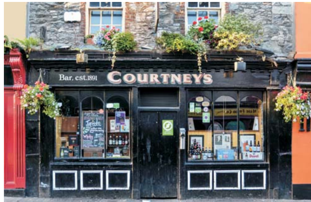
Typisch irisch: Pub in Killarney und Postmoderne, wie z.B. die umgestalteten Docklands mit der Samuel Beckett Bridge in Dublin

dieser Folder wurde CO 2 -neutral hergestellt