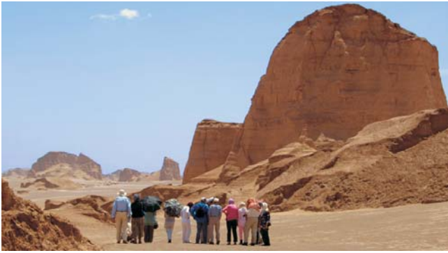
Landschaftsformung durch Wind - Wanderung in der Wüste Lut