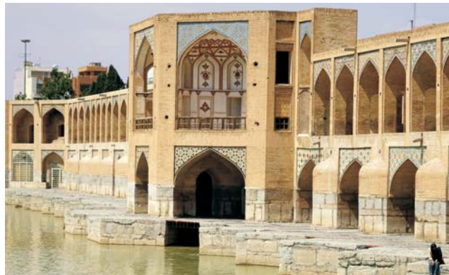
Isfahan - Pol-e Chādschu, Brücke von 1650 über den Zayandeh Rud