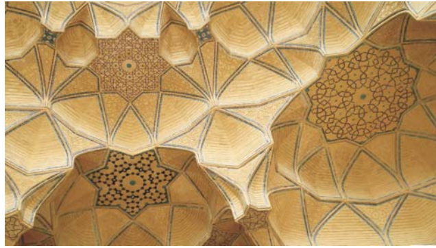
Isfahan - Detail des Südiwan der Jame-Moschee