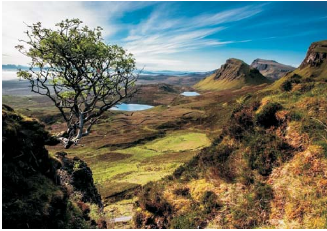
Skye - Trotternish-Halbinsel