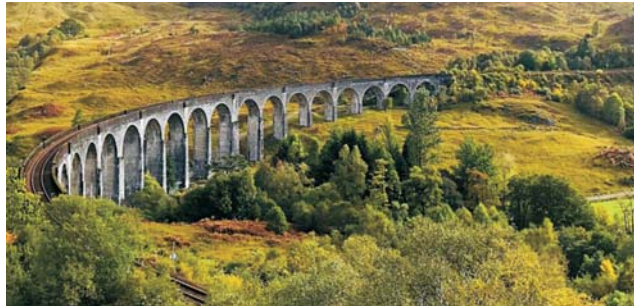
West Highland Railway

Am Anfang dieser erlebnisreichen Reise steht eine Stippvisite in Glasgow, dem modernen Herzstück Schottlands, das aus verfallener Altindustrie zur europäischen Kulturmetropole aufstieg. Ab Tag drei, mit Basis auf der Isle of Skye, dann Schottland pur: im schottischen Nordwesten begegnen wir einer einmaligen Natur- und Kulturlandschaft. Wildromantische Lochs, majestätische Berge und malerische Burgen sind nur die bekanntesten Aspekte dieses Landes. Ausgangspunkt unserer Exkursion ist der idyllische Küstenort Portree auf der Isle of Skye (Innere Hebriden). Von hier aus erkunden wir diese urwüchsige Insel mit dem Bus, mit dem Schiff, zu Fuß ( auf gut zu bewältigenden Wanderungen und Spaziergängen auf ausgewiesenen Pfaden. Gute Beweglichkeit ist Voraussetzung ) und mit der legendären West Highland Railway auf der „schönsten Zugfahrt Großbritanniens“. Zu entdecken gibt es eine Landschaft voller Geschichten: Die geologischen Spuren der Eiszeiten und die menschlicher Eingriffe, Küsten mit üppiger, fast mediterraner Vegetation, kulturelle Zeugnisse des Freiheitskampfes eines stolzen Volkes und der modernen Entwicklungsprobleme einer am äußersten Rand Europas gelegenen Region. Zur Abrundung der Exkursion steht am Ende noch die schöne und stolze Hauptstadt Edinburgh auf dem Programm.