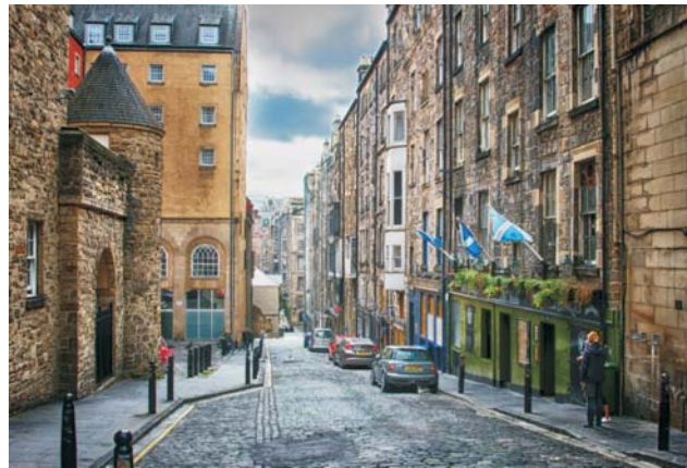
Altstadt von Edinburgh ▲

dieser Folder wurde CO 2 -neutral hergestellt