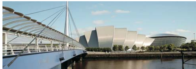
▼ Glasgow mit Clyde Auditorium

GEOPULS als Veranstalter für alle am Reisen interessierten Menschen wurde 2004 von Dozenten des Geographischen Instituts in Tübingen gegründet und arbeitet seitdem mit der vhs zusammen. Begeisterte Geographen und Landeskundler, die Natur, Kultur und Hintergründe eines Ziellandes bestens vermitteln können, führen Sie bei diesen Exkursionen. Wir versuchen dabei, ein Land möglichst umfassend zu bereisen, was bedeutet, dass neben den berühmten Sehenswürdigkeiten auch die Landesnatur Beachtung und Erklärung findet. Kleine Wanderungen und Spaziergänge in die Natur setzen deshalb immer wieder schöne und interessante Kontrapunkte zum Kulturprogramm. Nicht zuletzt gilt es, ein Land so authentisch wie möglich zu erfahren und dabei auch die oft übersehenen kleinen Dinge zu entdecken. Dies funktioniert am besten in einer überschaubaren Gruppe, weshalb die Teilnehmerzahl auf 16 Personen begrenzt ist.