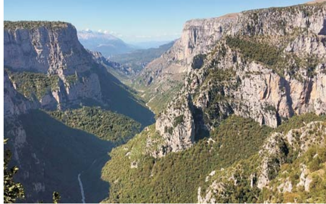
Blick vom Aussichtspunkt Beloi in die hier fast 1000 m tiefe Vikos-Schlucht

Wer gerne in mediterraner Natur wandert und gleichzeitig ein ansprechendes Kulturprogramm genießen möchte, für den ist diese Exkursion genau richtig. Die FAZ beschrieb vor einigen Jahren unser Exkursionsgebiet im Epirus, die Zagorachoria, nicht weit von der albanischen Grenze, als das „bestgehütete Geheimnis Griechenlands“. Und in der Tat, es handelt sich um die am dünnsten besiedelte Region ganz Griechenlands in einer geradezu arkadisch schönen Landschaft. Unterkunft nehmen wir ganz authentisch in einem der steinernen Bergdörfer in ca. 1100 m Höhe. In dieser ursprünglichen Umgebung essen und trinken wir was die herrliche Landschaft hergibt. Ein kulinarischer Genuß!