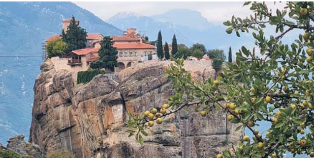
zu dramatischer Schönheit vereinigen sich Klöster und Landschaft Meteoras

Nach der Anmeldung zu dieser Reise wird mit der von GEOPULS zugesandten Buchungsbestätigung eine Anzahlung (15% des Reisepreises) fällig. Die Restzahlung erfolgt zwei Wochen vor Reisebeginn. Es gelten die Geschäftsbedingungen des Veranstalters: Geopuls GbR, Neckarhalde 62, 72108 Rottenburg. Bitte beachten Sie vor Reisebuchung unsere Allgemeinen Reisebedingungen sowie das Formblatt zur Unterrichtung des Reisenden bei einer Pauschalreise nach § 651a des BGB (EU-Richtlinie 2015/2302). Beides schicken wir gerne vor Buchung zu oder kann auf unserer Homepage eingesehen werden. www.geopuls.de