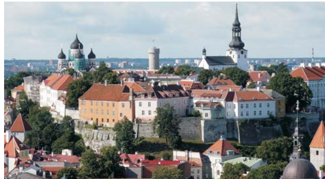
Estland: Oberstadt mit Alexander-Newski-Kathedrale in Tallinn