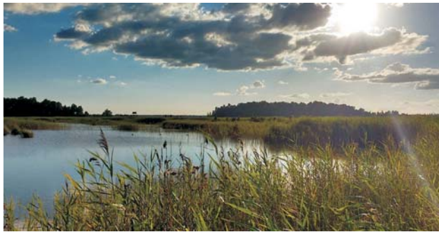
Eiszeit: einer der zahlreichen Seen in den Moränenlandschaften des Baltikums

dieser Folder wurde CO 2 -neutral hergestellt