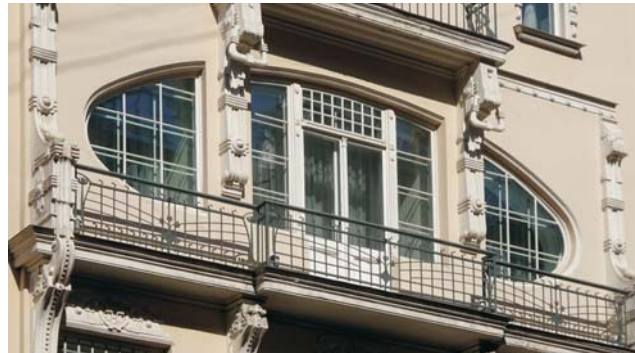
Lettland: Fenster im Jugendstilviertel von Riga

Die waldrreichen und von Moränen der letzten Eiszeit geprägten, äußerst reizvollen, seenreichen Landschaften sind recht dünn besiedelt. Hier trifft der Reisende auf trutzige Burgen, prächtige Schlösser und idyllische Dörfer. Die glanzvollen Städte hingegen, die auf Jahrhunderte abwechslungsreicher Geschichte zurück blicken, waren bedeutende Handelsstädte der einst mächtigen Hanse. Mit sehr unterschiedlichen Sprachen haben die baltischen Länder bis heute ihre eigenen Wurzeln und Identität bewahrt. Während Lettland, einst Teil des Deutschen Ordens, der Reformation zusprach, blieb Litauen katholisch während Estland enge kulturelle Verbindungen zu Finnland pflegt. Seit ihrer erneuten Unabhängigkeit 1990/91 und dem EU-Beitritt 2004 haben die baltischen Staaten eine beachtenswerte Entwicklung vollzogen, die sich vor allem im Straßenbild der Städte widerspiegelt. Unsere Route umfasst beides: die größeren Städte wie Vilnius, Kaunas, Klaipeda (Memel), Riga und Tallinn, verläuft aber ebenso durch die beschaulichen ländlichen Regionen (z.B. Trakai, Ostseebad Palanga, Krimulda, Turaida, Sigulda) und zu wunderschönen Landschaften (z.B. Kurische Nehrung mit ihren Dünen, oder der Gaujas Nationalpark mit imposantem Urstromtal und die Jägala-Wasserfälle östlich von Tallinn).