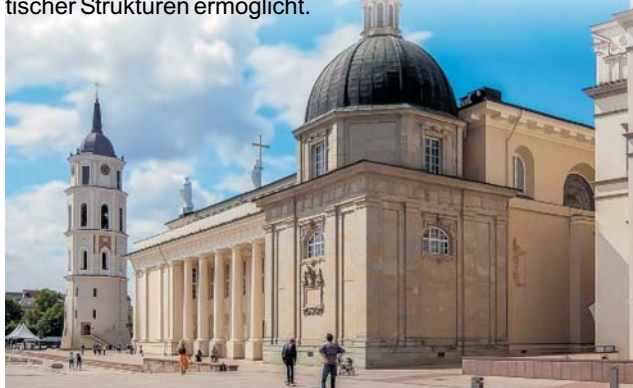
Litauen: Domplatz mit frei stehendem Glockenturm

GEOPULS wurde 2004 von Dozenten des Geographischen Instituts in Tübingen gegründet. Begeisterte Geographen, die ein Land durch Ihre Arbeit von allen Seiten kennengelernt haben, führen Sie durch Kultur und Natur des Reiseziels, wobei es, neben den touristischen Höhepunkten, immer noch etwas mehr zu sehen und zu erleben gibt. Wenig Bekanntes, tiefe Einblicke, das Erkennen von Zusammenhängen in Kultur- und Naturraum, Hintergründiges. Ausflüge in die Natur mit der einen oder anderen kleinen Wanderung gehören dazu, um auch die landschaftlichen Besonderheiten und deren Schönheit kennenzulernen und zu genießen. Die Teilnehmerzahl ist je nach Reise auf angenehme 12 bis max. 18 Personen beschränkt, was auch noch ein Reisen abseits massentouristischer Strukturen ermöglicht.