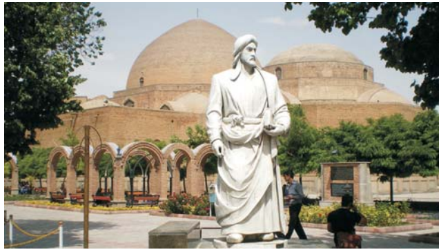
Blaue Moschee und Denkmal für den Dichter Chaqani in Tabriz