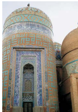
Grabturm (14. Jh.) in Ardabil

Nach der Anmeldung zu dieser Exkursion wird mit der von GEOPULS zugesandten Buchungsbestätigung eine Anzahlung (15 % des Reisepreises) fällig. Die Restzahlung erfolgt zwei Wochen vor Reisebeginn. Es gelten die Geschäftsbedingungen des Veranstalters: Geopuls-Studienreisen, Neckarhalde 62, 72108 Rottenburg a.N. (Tel. 07472-9808802). Die Allgemeinen Reisebedingungen werden gerne vorab zugeschickt. Sie können bei der VHS eingesehen, oder auch von der Homepage www.geopuls.de ausgedruckt werden.