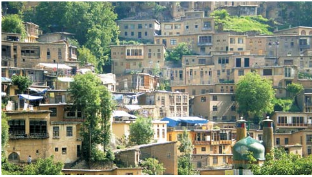
Gebirgsdorf Masuleh, Alburz-Gebirge