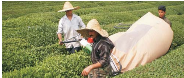
oben: Vulkanische Ablagerungen südöstlich des Saband unten: Ernte auf einer Teeplantage bei Fuman

GEOPULS als Reiseveranstalter wurde 2004 von Dozenten des Geographischen Instituts in Tübingen gegründet und arbeitet seitdem mit ausgewählten Volkshochschulen zusammen. Begeisterte Geographen, die ein Land durch Ihre Arbeit während vieler Aufenthalte von allen Seiten kennen gelernt haben, führen Sie durch Kultur und Natur des jeweiligen Reisezieles. Bei einer Reise mit Geographen gibt es, neben den touristischen Höhepunkten, immer noch etwas mehr zu sehen und zu erleben. Wenig Bekanntes, tiefe Einblicke, das Erkennen von Zusammenhängen in Kultur- und Naturraum, Hintergründiges. Ausflüge in die Natur mit der einen oder anderen kleinen Wanderung gehören dazu, um auch die landschaftlichen Besonderheiten und deren Schönheit kennenzulernen und zu genießen. Die Teilnehmerzahl ist je nach Reise auf angenehme 12 bis max. 16 Personen beschränkt, was auch noch ein Reisen abseits massentouristischer Strukturen ermöglicht.