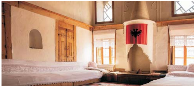
Wohnraum in einem traditionellen Bürgerhaus in Gjirokastra

Nach der Anmeldung zu dieser Exkursion wird mit der von GEOPULS zugesandten Buchungsbestätigung eine Anzahlung (15 % des Reisepreises) fällig. Die Restzahlung erfolgt zwei Wochen vor Reisebeginn. Es gelten die Geschäftsbedingungen des Veranstalters: Geopuls GbR, Neckarhalde 62, 72108 Rottenburg (Tel. 07472-9808802). Bitte beachten Sie vor Reisebuchung unsere Allgemeinen Reisebedingungen sowie das Formblatt zur Unterrichtung des Reisenden bei einer Pauschalreise nach § 651a des BGB (EU-Richtlinie 2015/2302). Beides schicken wir vor Buchung gerne zu, oder kann auf/von der Webseite www.geopuls.de eingesehen und ausgedruckt werden.